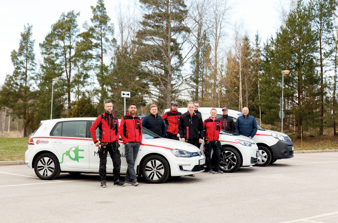
Några av KFAB:s medarbetare på fastighetsavdelningen.

Enklaste vägen till felanmälan: fel@kfab.se